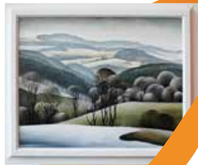
Obraz: U Olešnice Olej na plátně, rozměr: 40 x 50 cm Vyvolávací cena: 4 000,-

Malíř má na svém kontě přes 30 samostatných výstav a 10 výstav kolektivních, a to s Uníí Výtvarných umělců ČR. Jeho obrazy se nachází v soukromých sbírkách ve Francii, Anglii, Německu a v USA. V nedávné době k těmto zemím přibýlo také Japonsko.