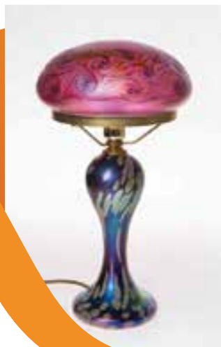
Secesní stolní lampa