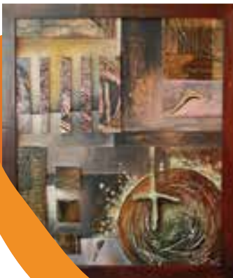
Obraz: A ty jsi z které planety?