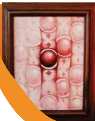
Obraz: Kuličky Akryl Rozměr: 50 x 40 cm Vyvolávací cena: 2 000,-