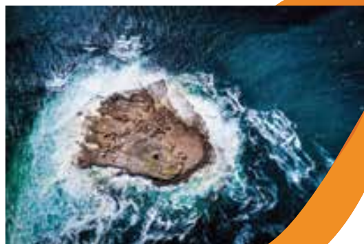
Fotografie: Ostrov Krabů Rozměr: 21 x 30 x 2 cm Vyvolávací cena: 5 000,-

Petr Jan Juračka je jeden ze současných předních fotografů přírody. Přestože se nevěnuje fotografování divokých zvířat, a krajinu fotografuje spíše jako svého koníčka, jeho oborem jsou fotografie přírody, které mnohdy ukazují nečekané příběhy fenomény, kterým se Petr mj. věnuje na Přírodovědecké fakultě Univerzity Karlovy. Jako přírodovědec, ale také jako ambasador značek Nikon a DJI či prostě milovník dobrodružství a výzev procestoval s fotografickou a filmařskou technikou Afriku, Asii, Grónsko, střední a jižní Ameriku, Austrálii či Japonsko.