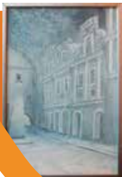
Obraz: Staré pardubice v zimě

Narodil se v roce 1952 v Pardubicích. Absolvoval katedru jevištního výtvarnictví na Divadelní fakultě AMU v Praze. Působil v angažmá v divadlech v Opavě, Hradci Králové a Olomouci. Od roku 2002 je ve svobodném povolání. Spolupracuje s řadou českých a moravských divadel. Je autorem knižních ilustrací. V roce 2008 vytvořil návrh expozice „Tajemné znojenské podzemí.“ Ta byla zpřístupněna v roce 2009 a získala prvenství v ceně portálu Kudy z nudy.