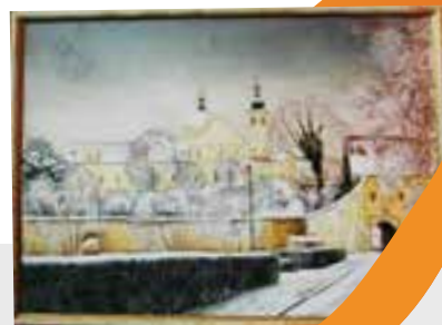
Obraz: Pardubický zámek